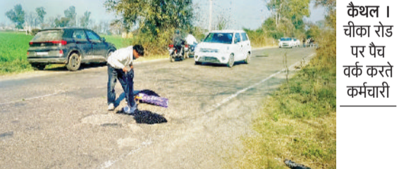
कैथल । चौका रोड पर पैच वर्क करते कर्मचारी

मुख्यमंत्री के प्रस्तावित कैथल दौरे को लेकर लोक निर्माण विभाग अचानक सक्रिय नजर आया। कैथल-पटियाला मुख्य मार्ग, जो पिछले करीब तीन वर्षों से जर्जर अवस्था में था, उस पर मुख्यमंत्री के गुजरने की सूचना मिलते ही महज तीन घंटे के भीतर सैकड़ों गड़कों को भर दिया। स्थानीय लोगों के अनुसार यह सड़क लंबे समय से बेहद खस्ता हालत में थी। कैथल से चौका तक का यह मार्ग जगह-जगह टूट चुका था, गहरे गड़कों के कारण आए दिन हादसे होते रहे, कई बार लोग घायल हुए और वाहन क्षतिग्रस्त हुए। इसके बावजूद विभाग की ओर से तो न तो स्थायी भरमत्त की गई और न ही सड़क को दुरुस्त करने की कोई ठोस योजना बनी। क्षेत्रवासियों ने कई बार शिकायत की,