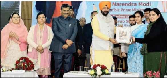
Narendra Modi on the Prime Minister's Memento.