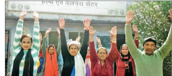
जींद। सूर्य नमस्कार करते साधक।