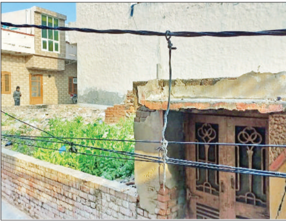
कैथल। गली में लटक रहे बिजली के तार।