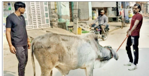
पूंडरी। शहर से गोवंश को पकड़ते एजेंसी कर्मचारी।