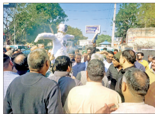
जींद। मांगों को लेकर प्रदर्शन करते भाजपा कार्यकर्ता।