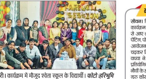
पूडरी। कार्यक्रम में मौजूद शता स्कूल के विद्यार्थी।