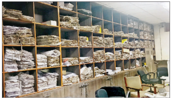
कैथल। हड़ताल के चलते खाली पड़ी तहसीलदारों की कुर्सी।

जिले में तहसीलदारों की हड़ताल का असर दूसरे दिन शुक्रवार को भी देखने को मिला। हड़ताल के चलते तहसीलों में होने वाले महत्वपूर्ण राजस्व कार्य पूरी तरह से ठप रहे। कार्यालयों में खाली पड़ी कुर्सियां देखी गईं। इंतकाल, जाति प्रमाण पत्र, आय प्रमाण पत्र और रजिस्ट्री से जुड़े मामलों का निपटारा नहीं हो सका, जिससे आम नागरिकों को भारी परेशानियों का सामना करना पड़ा। सुबह से ही बड़ी संख्या में लोग अपने कामों को लेकर तहसील कार्यालय पहुंचे, लेकिन कमचरियों के हड़ताल पर होने के कारण उन्हें निराश होकर लौटना पड़ा। विशेष रूप से छात्रों और ग्रामीण क्षेत्रों से आए लोगों को अधिक दिक्कतों का सामना करना पड़ा, जिन्हें समय पर जाति व आय प्रमाण पत्र की आवश्यकता थी।