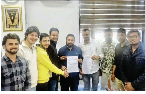
जौद । वीसी के ओएसडी को जापान सौंपते हुए छात्र नेता।