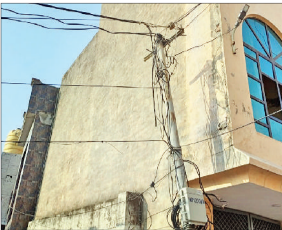
कैथल। टेलीफोन के खंभे पर लगाए गए बिजली के तार।