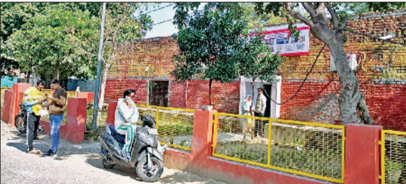
जींद। मशीन ठीक होने पर एक्सरे करवाने आए मरीज।

एक्स रे सेवा शुरू होने से मरीजों और उनके परिजनों को राहत मिली है। स्वास्थ्य विभाग द्वारा संबंधित एजेंसी को मशीन ठीक करने के दिशा-निर्देश दिए गए थे। तकनीकी खामियों को दूर कर एक्सरे सेवा शुरू होने से मरीजों को राहत मिली है। अब मरीजों को ओपीडी और इमरजेंसी दोनों में ही एक्सरे के लिए बाहर नहीं जाना होगा।